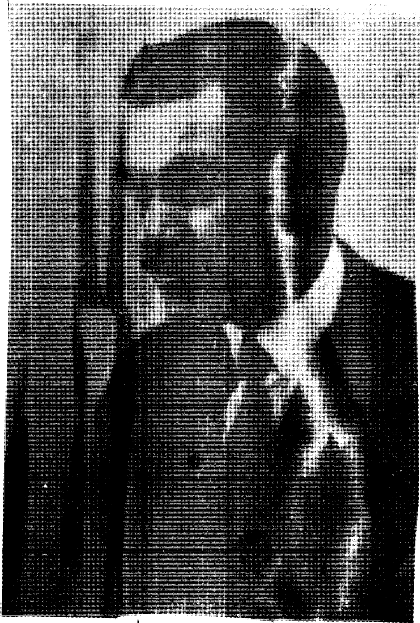
المؤلف لوثر ب. ستودارد